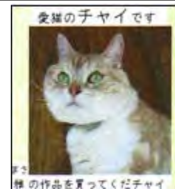
雅の作品を買ってくださいチャイ

ロックとボクシングが大好きな 42 歳 黒川温泉がある阿蘇の南小国出身 某バンドのボーカルとしてデビューの 経験あり。ラジオDJ、イベントMC、 リポーターとしても活動中