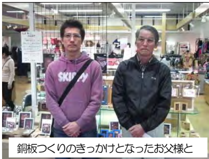
銅板つくりのきっかけとなったお父様と