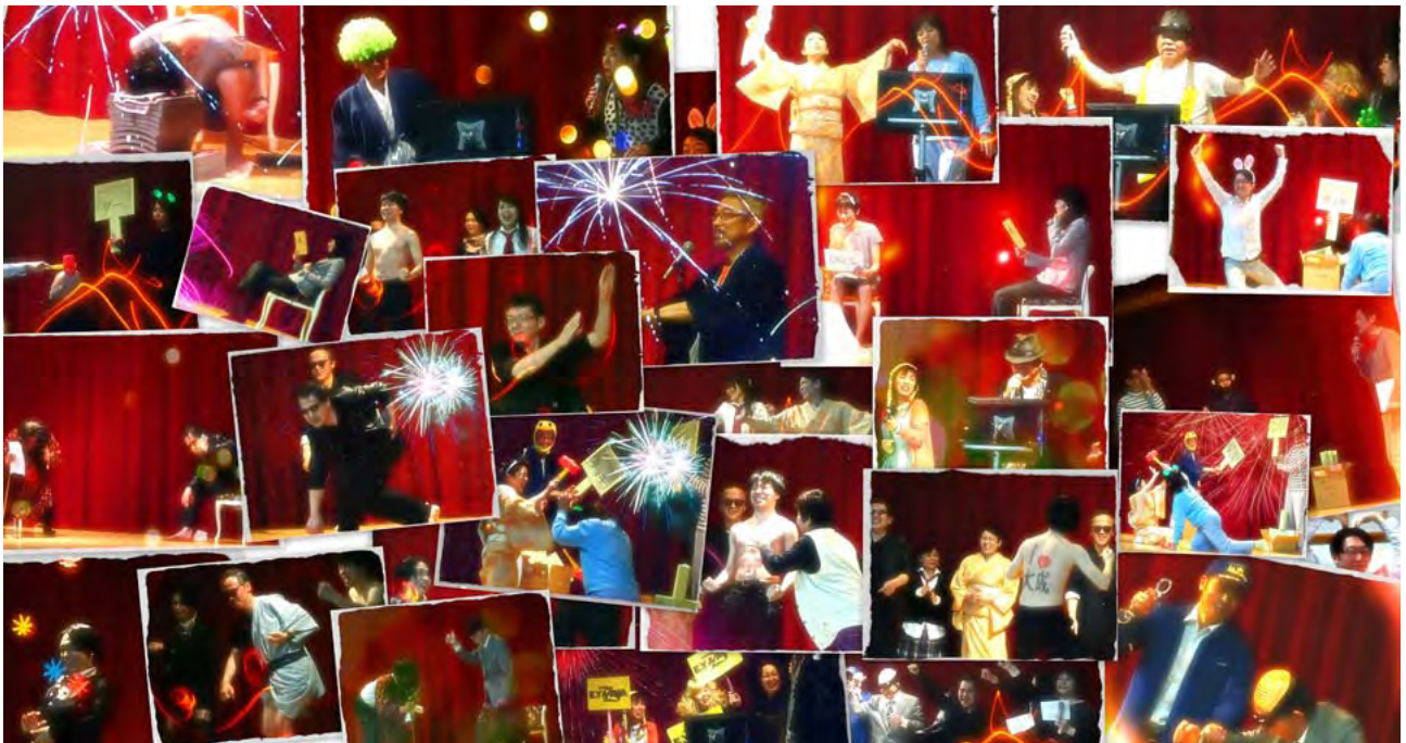
3月28日に行われました確定申告慰労会の様子です

大成経営コンサルティンググループは、財務会計総合コンサルタント業として、 企業経営に関するあらゆるご相談にワンストップで対応しております。